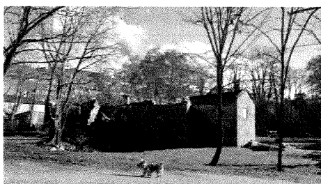
Terrenos cerca de la calle de O Muíño que forman parte del parque fluvial del río de Os Gafos.